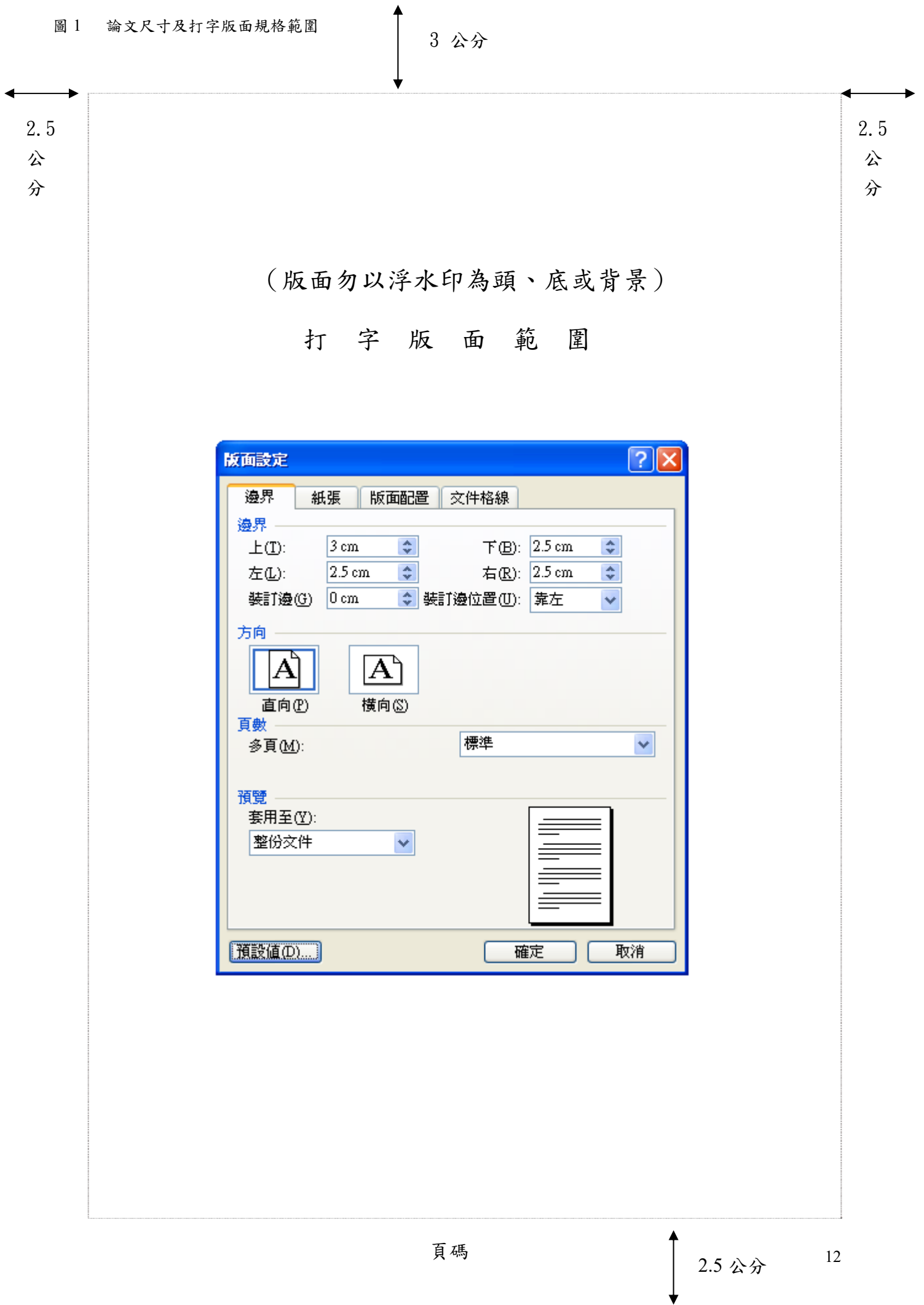
圖 1 論文尺寸及打字版面規格範圍